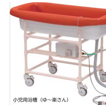
小児用浴槽 (ゆ〜楽さん)