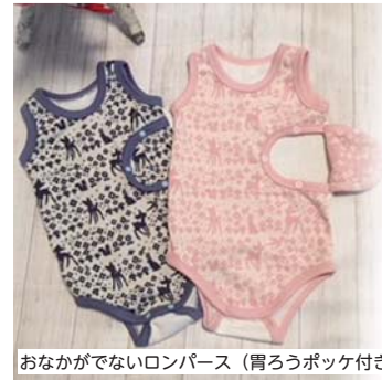
おなががでないロンパース (胃ろうポッケ付き)