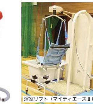
浴室リフト (マイティエースII)

抱っこによる介助は限界があります。様々な福祉用具を小さいうちから活用することがとても大切。ぜひ、体験してみてください！