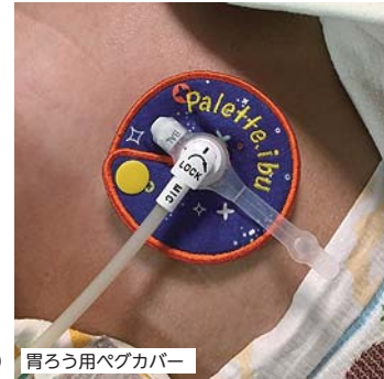
胃ろう用ペグカバー