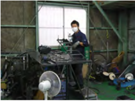
心優しい鉄鋼部門のスタッフたち

・どんな人が何をしているの？ これから少しずつトッケン内 部を紹介していきたいと思いま