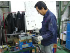
組立梱包・発送部門の若手スタッフたち